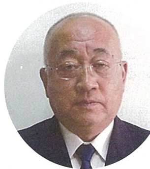
指導普及部次長 事業部次長