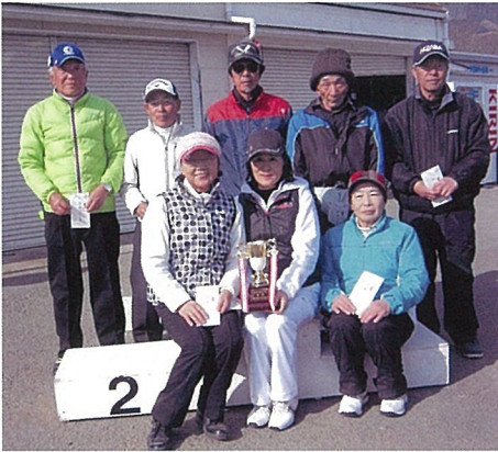
優勝した中井町PG協会の皆さん