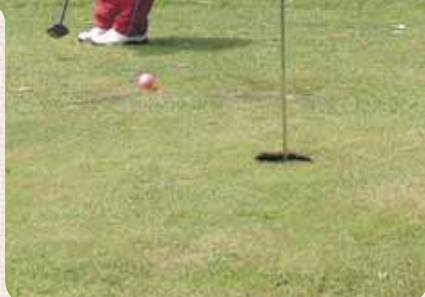
北海道標津町 町宮川北PG場にて(H20. 6. 15撮影)