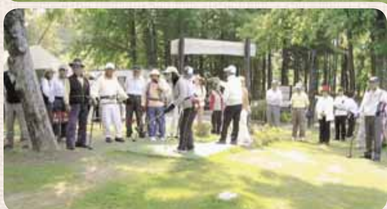
熊本県熊本市 ふれあいの森くまもとPG場にて(H20. 5. 26撮影)