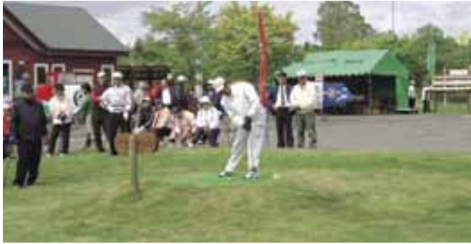
標津町に快音響かせ第22回北海道オープン！