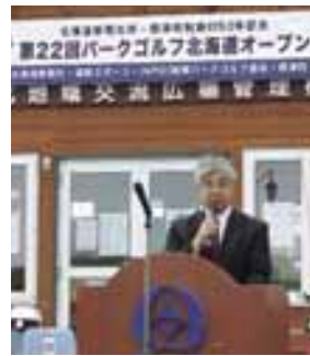
あいさつする 金澤標津町長