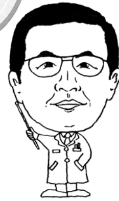
明官先生 みょうかん

暑い季節を迎えています。スポーツに「汗」はつきもので、スポーツ後の「汗」にはさわやかな爽快感がありますが、「汗」には人体を物理的にコントロールする大切な体温調整機能があります。汗をかくという現象は、体熱を放散しようとする体の機能によって起きます。多量の汗が出るということは、それだけ体温が上昇したことを示しています。汗のメカニズムを知って汗と、上手につきあいましょう。