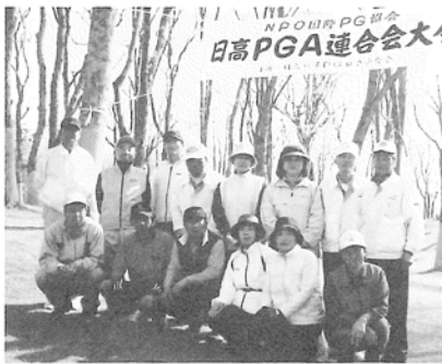
喜びの上位入賞者