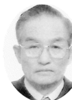
秋田県 長谷山 光