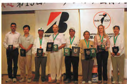
外国人の部 (男・女)