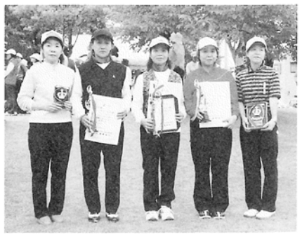
“女の戦い”を制し満面の笑み