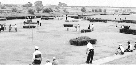
富士山を望むコースに320人