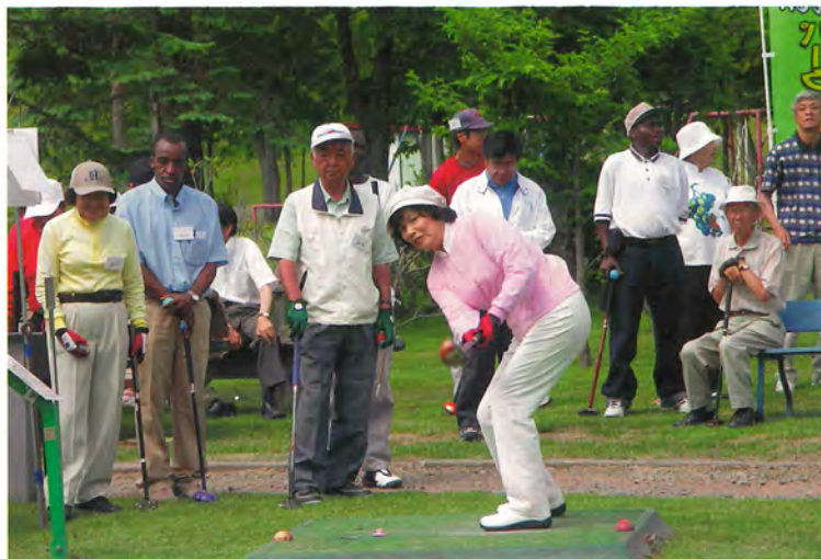
部門混合のパーティーでプレー