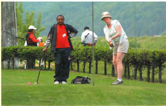
フォームもきまってマス!!