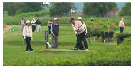
初の72ホールは大接戦