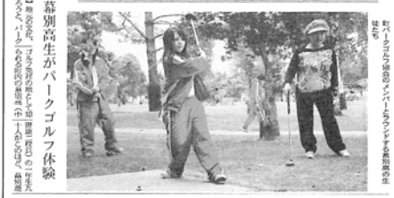
幕別高校生がパークゴルフ体験 「幕別町パークゴルフ協会」の指導員による指導を受け、パークゴルフの楽しさを体験した。