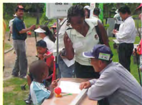
「おじちゃん、ボクと遊んで…」