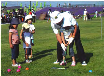
まずは、クラブの握り方から手ほどき