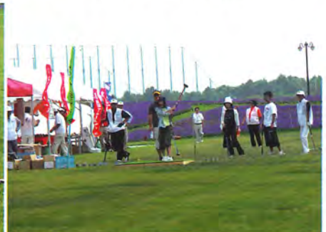
ラベンダーを背に初心者教室