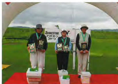
シニアの部・女子