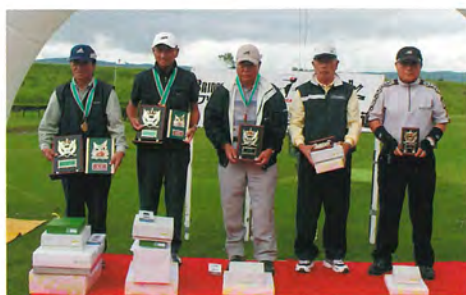
シニアの部・男子