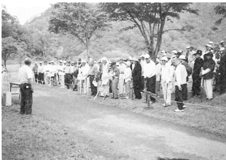
緑に囲まれたコースに一堂会す