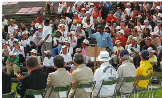
開会式で各国選手紹介

道内はもとより遠くは福岡県大宰府市からの参加もありました。外国人は、在留の中国、ケニア、スリランカ、カナダなど31ヶ国79名の参加がありました。外国人の方の中には、この日がPG初体験という方もいましたが、一緒に回る日本人の方が「先生」となって36ホールを楽しみました。言葉が通じなくても、「楽しいこと」に国境はありません。PGは、世界中の誰もが楽しめるスポーツです。プレーの後は、お楽しみの交流会。去年まではプレー後その場での焼肉パーティでしたが、今年は、会場を町内のホテルに移しレセプション形式に。アトラクションでは、音更町の笑楽会の皆さんによる郷土芸能「ひよっこ踊り」で盛り上がりました。また、アフリカ人の皆さんが、お国の唄と踊りを披露。民族衣装を身にま