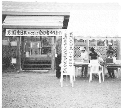
選手の出迎え準備

第一回大会となった今回は、千葉県、埼玉県、福島県、宮城県、秋田県、山形県内各地から216名が参加して行われました。入賞に向けて接戦が繰り広げられ、男女とも地元山形県と千葉県の競い合いとなりました。競技終了後の懇親交流会では、お楽しみ抽選会で特産のさくらんぼ・お米銘柄米・飯豊産のヒメのモチ米など...。どんだん名前が呼ばれて、会場あちこちで歓声が上がり賑やかな大宴会となりました。