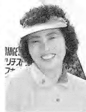
纈纈末子さん (幕別町協会)

発祥時から数々の大会を連覇してきたが国際は役員のため出場回少なく2度目で念願の優勝。北海道オープンには3連覇4勝の女子一人者キャリア12年