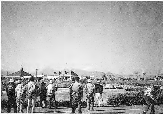
観客のむこうに富士山が見える

今年は岩手の大野村、沖縄の宮古島、秋田の湯沢市、石川の金沢市等初参加組が注目されました。