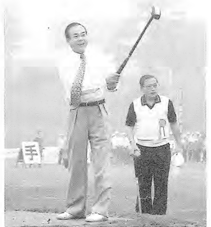
役員もプレーしてみました

日本一の選手を決めるため今年から始まった選手権。各地の腕自慢が集めた大会は初のテレビ放映もされました。