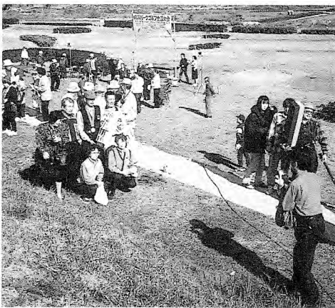
最後は和やかに記念撮影