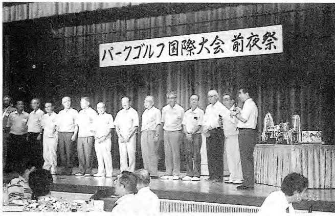
神奈川県開成町の選手団（前夜祭にて）