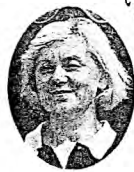
シャーロフ夫妻 (ソビエト)

パーデイ四、OBは一回だった。暑くて少し疲れたけど、楽しかった。来年参加する人のためにも、ロランC基地に早くコースを造りたい。