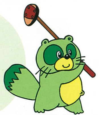
グリーンサイト広場