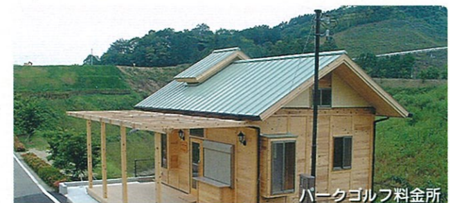
パークゴルフ料金所