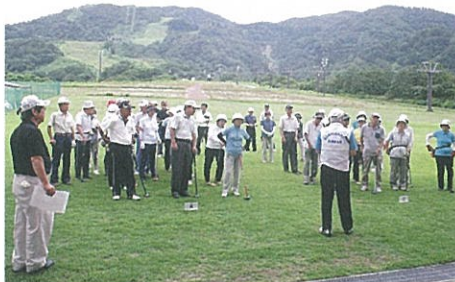
南砺市協会 (富山県)