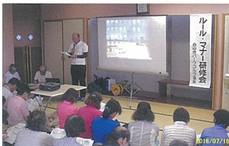
白山市協会 (石川県)