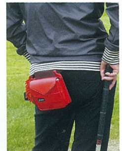
ボールが見当たりません。手に持っていますか？