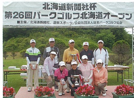
シニアの部 男女入賞者