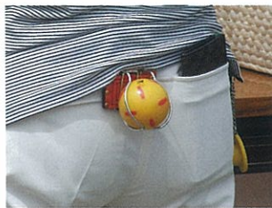
シンプルです。そのかわりポケットが重要