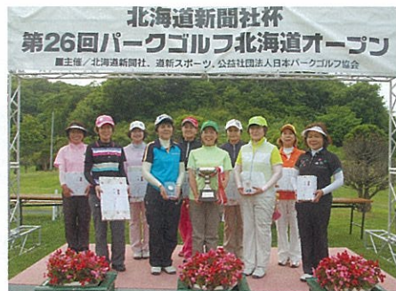
一般の部 女子入賞者