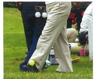
一時期流行ったそうですが、最近あまりお目にかかりません