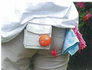
ボール1個とティ、ポーチの中は？

また、ボールホルダーなど腰に位置するグッズを観察すると、これも随分機能的でかつ華やかさを感じましたので、今回はそこに焦点をあててみました。