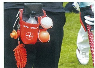
ボールにティ、手袋にボール拭きもウェアの黒にどれも色が映えています。配色Aクラス