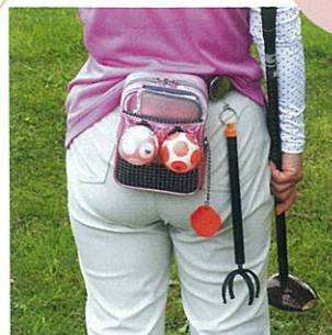
ボールキャッチャーなど、いろんなグッズがありますね。ポーチから見えているのはカードケースでしょう。