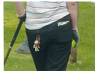
ポーチさえ不要です。ボールは1個でいい、身軽が第一