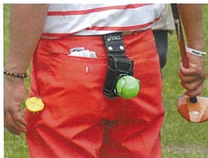
シンプル+ポーチ、これはシッポ型