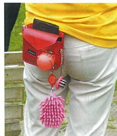
かなり派手になってきました。ボール拭きは最近流行りとか