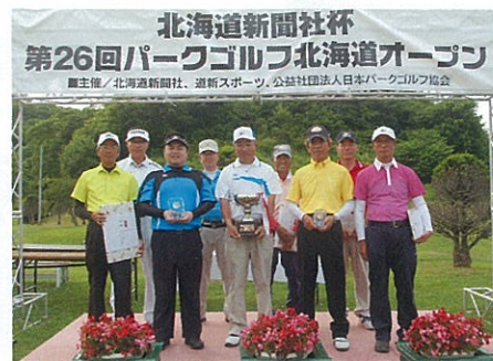
一般の部 男子上位入賞者