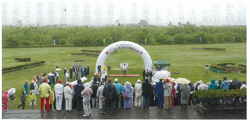
視察に訪れた第26回パークゴルフ国際大会

ところで、ツーリズムを成功させるためには、いったい何が重要だと考えますか。それは、まず再訪者いわゆるリピーターを増やすことです。一般的に、スポーツ・ツーリズムは、スポーツが持つ周期性によって、再訪者の集客効果が期待できるといわれています。言いかえれば、パークゴルフでいいますと、一度プレーしたコースや大会に、またこのコースでプレーしてみたい、来年もこの大会に参加してみたいといったような感動や欲求を参加者に与えることができれば、再訪者の集客効果が期待できるということになります。その感動や欲求を与えるためには、特別な大会、すばらしいコース、温泉、美味しい食事といったような観光資源をアピールすることはもちろんのこと、ホスピタリティー（おもてなし）も大切です。