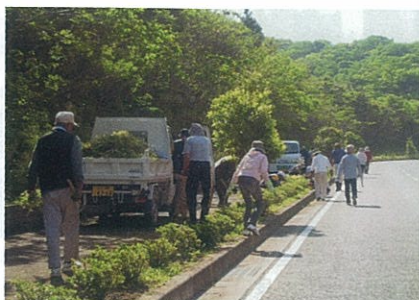
(写真：つつじ植樹地の草取り作業)