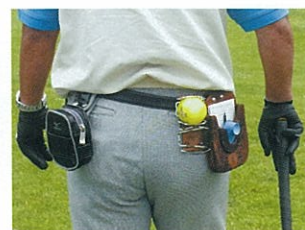
左右にぶら下げています。バランスが良い？