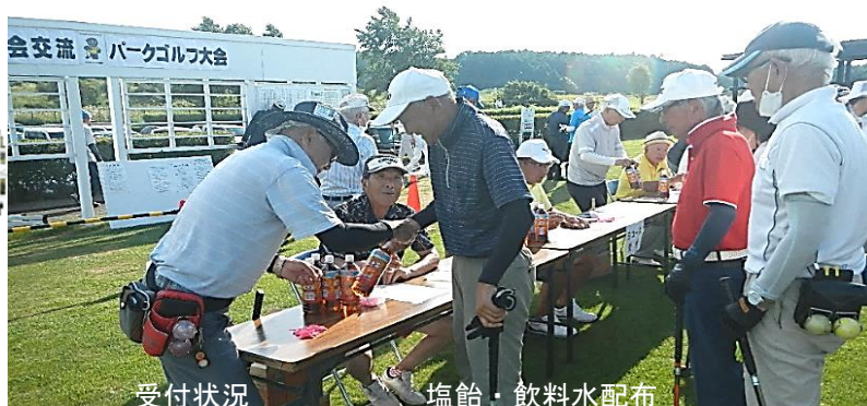
受付状況 塩飴・飲料水配布